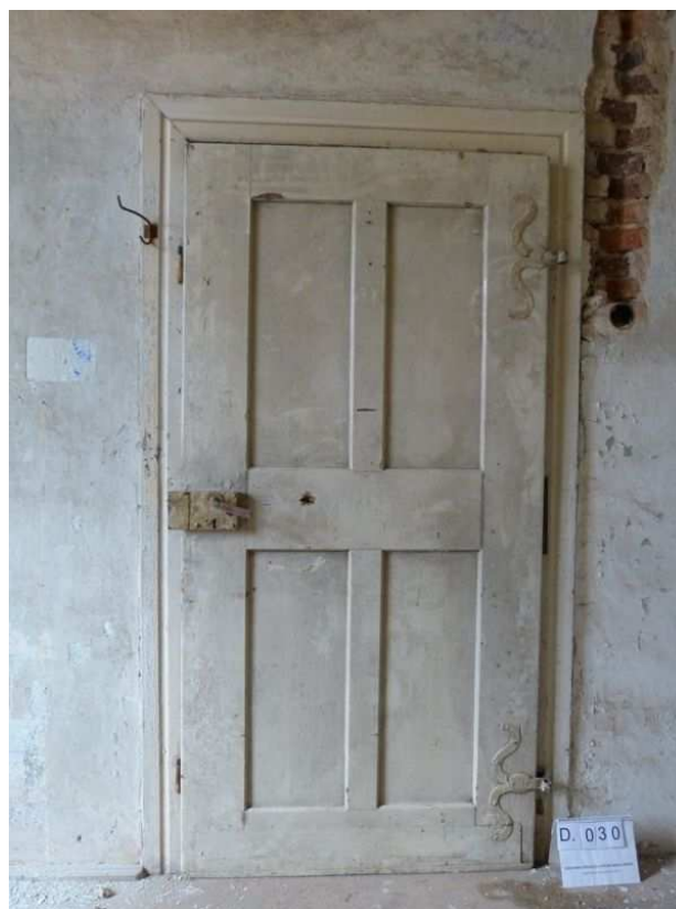
Ukázka osazení dveří na své původní místo