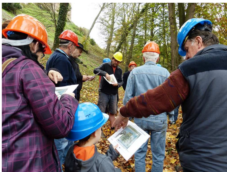
Komentovaná prohlídka hradního parku před zahájením prací