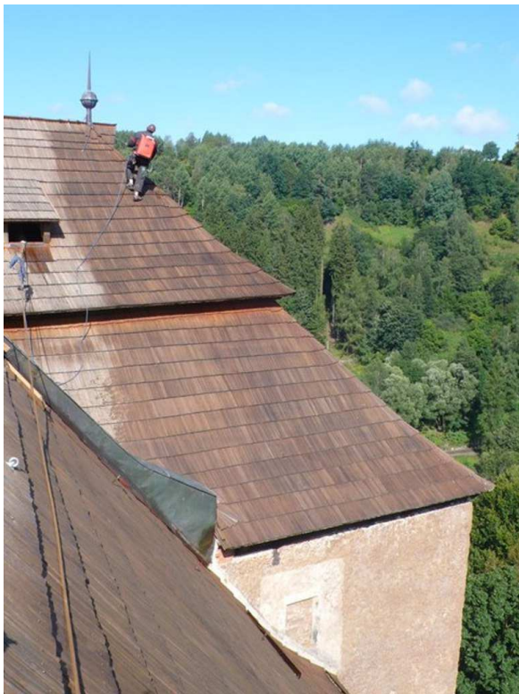
Udržovací nátěr šindelové střechy hradu