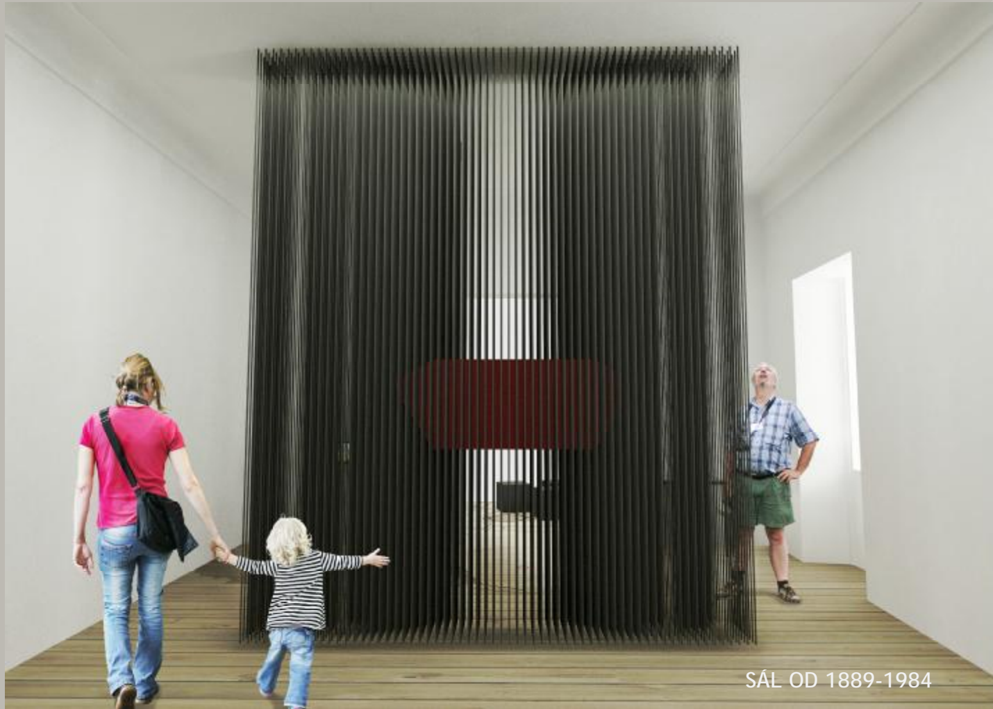
SÁL OD 1889-1984