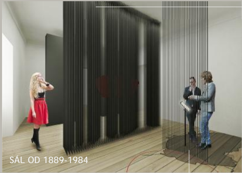
SÁL OD 1889-1984

MOŽNÁ POLOHA NEZNÁMÉHO PŘEDMĚTU struktura lanek lemující výšež kružnice znázorňuje údaj o poloze neznámého předmětu - 150 km od Norimberku na území ČSSR