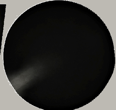
PŮDORYS POHYBU EXPOZICÍ

→ prohlídka expozice dle tematické a časové posloupnosti → trasa pro spěchající diváky prohlídka relikviáře