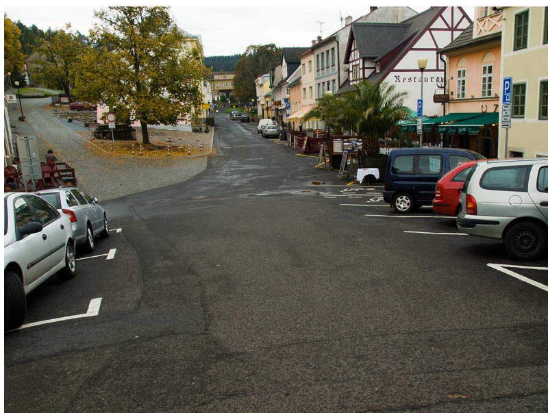
Obrázek 2 - Parkoviště

Hrad a zámek leží přímo v centru obce. Hrad a zámek spolu sousedí. Hrad bude opravován a pro veřejnost uzavřen až do roku 2017.