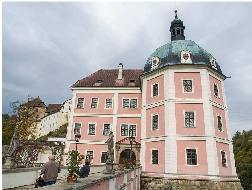
Obrázek 1 - Celkový pohled

Hrad a zámek leží přímo v centru obce. Hrad a zámek spolu sousedí. Hrad bude opravován a pro veřejnost uzavřen až do roku 2017.