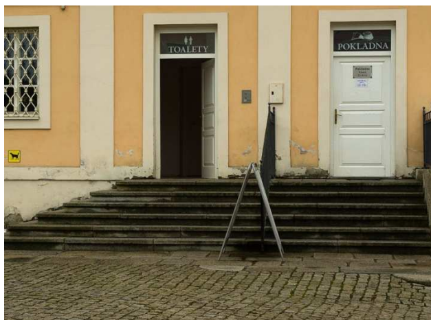
Obrázek 7 - Přístup k toaletám

Toalety vyhrazené pro handicapované návštěvníky na zámku nejsou. Přístup k toaletám je po schodech a s několikerymi úzkými dveřmi. Pro tělesně postižené návštěvníky jsou přístupné jen s asistencí.