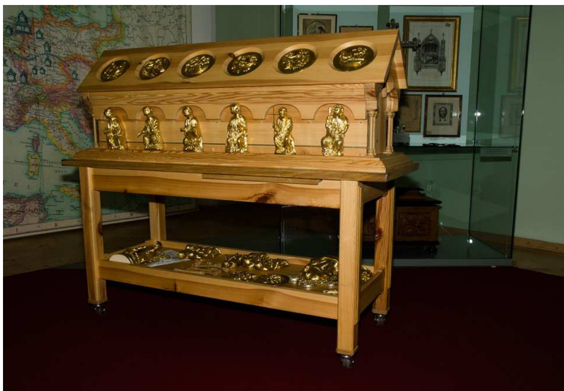
Obrázek 6 - Haptický model relikviáře

Na zámku probíhá několik různých prohlídkových okruhů. Absolvoval jsem, a to individuálně, prohlídku pro nevidomé s výkladem, "Relikviář Sv. Maura". Haptický model relikviáře je ve skutečné velikosti. Během výkladu si nevidomí maketu relikviáře ohmatávají, mají tak možnost prostorové představy a také mohou zkoumat kvalitu provedení sošek a reliéfů. Relikviář se skládá ze 14 odlitků sošek a 12 reliéfů, jak ukazuje fotografie níže.