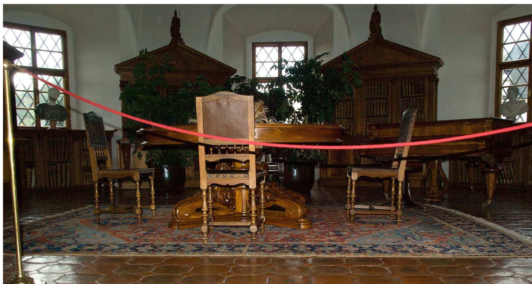
Obrázek 5 - Pohled na exponáty

Na zámku probíhá několik různých prohlídkových okruhů. Absolvoval jsem, a to individuálně, prohlídku pro nevidomé s výkladem, "Relikviář Sv. Maura". Haptický model relikviáře je ve skutečné velikosti. Během výkladu si nevidomí maketu relikviáře ohmatávají, mají tak možnost prostorové představy a také mohou zkoumat kvalitu provedení sošek a reliéfů. Relikviář se skládá ze 14 odlitků sošek a 12 reliéfů, jak ukazuje fotografie níže.