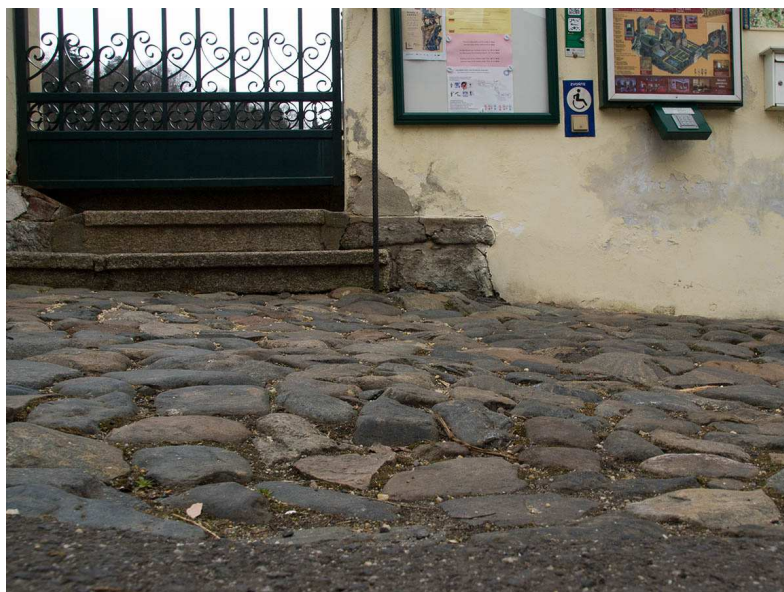
Obrázek 3 - Přístup ke zvonku

Mezi parkovištěm a zvonkem je asi 1 metr dlouhý, mírně se zvyšující kamenitý povrch, který návštěvníkům na vozíku přístup ke zvonku mírně komplikuje. Dle průvodkyně, která mne doprovázela, je vždy k dispozici pracovník, připravený vozíčkáři s čímkoliv na požádání pomoci.